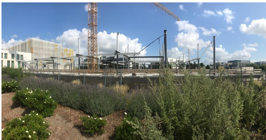
Zomerrust op de bouwplaats

De totale bouwperiode SHARE zal ongeveer anderhalf jaar in beslag nemen. De oplevering staat gepland in juli 2020.